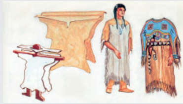
nach Whiteford 1973 NORTH AMERICAN INDIAN ARTS

Wie beim verzierten Leder üblich zeigt die Fleischseite der Felle nach außen. Im späten 19.Jh. wird der untere Saum des Kleides, wie hier, gerade geschnitten.