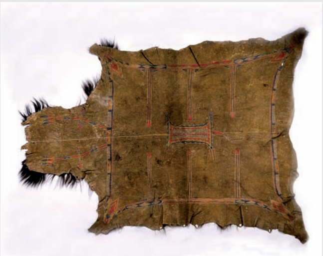
Gesamtaufnahme der Bisondecke, Inv.Nr. 31-33-1