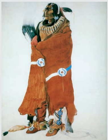
Krieger, Mandan, nach Karl Bodmer

Ab Mitte des 19. Jahrhunderts wurden solche in der Anfertigung recht aufwendigen Fellumhänge durch Woldecken ersetzt, welche die Jäger durch Tauschhandel mit den amerikanischen Pelzhändlern erhielten.