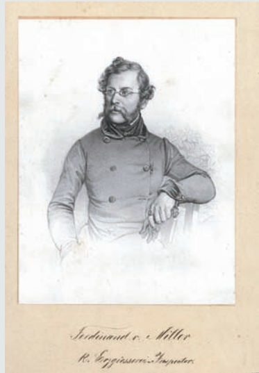
Klischee nach einer Zeichnung