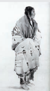
Sioux-Frau, nach Karl Bodmer

Der Uhang der Frau war dagegen mit abstrakten Motiven kunstvoll dekoriert und wurde von einer Frau hergestellt. Die geometrischen Formen lassen sich nicht mehr deuten, wohl aber die ethnische Herkunft der Malerei. Im Fall von diesem Uhang kann man von „ Border-and-hourglass design “ sprechen.